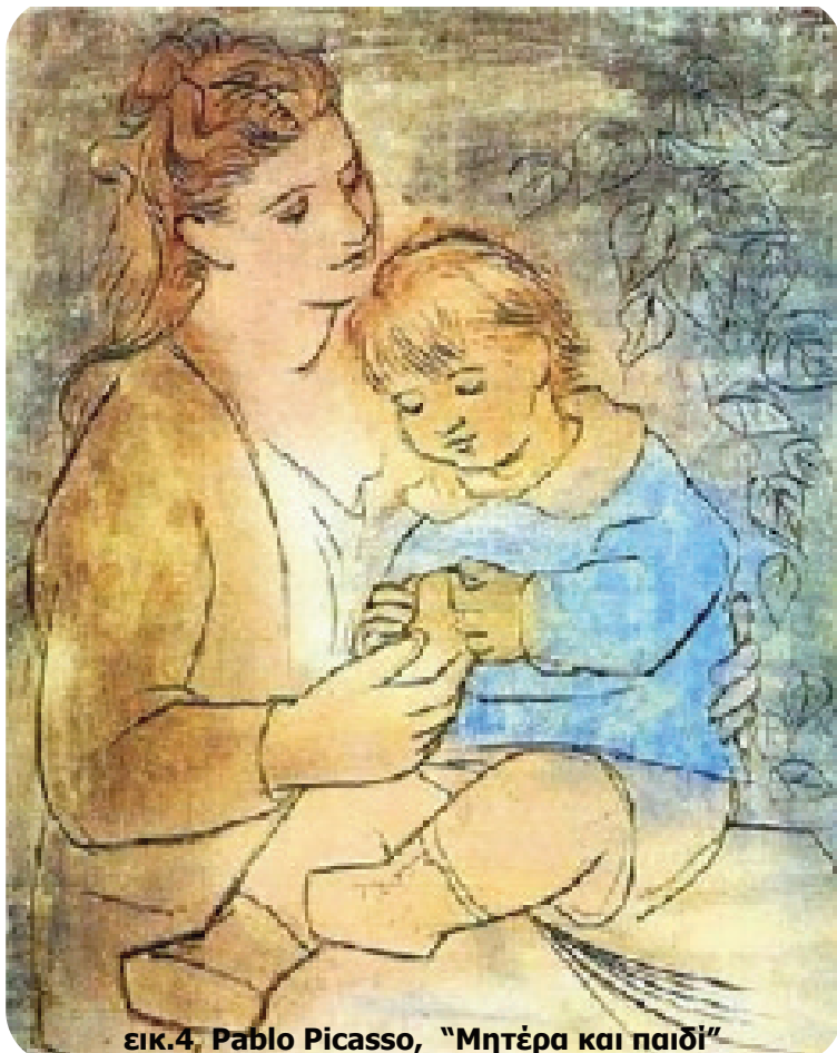
εικ.4. Pablo Picasso, "Μητέρα και παιδί"

διαφέροντα των παιδιών της συγκεκριμένης ηλικίας στα οποία απευθύνεται, αλλά και να μεταδώσει αυτή τη γνώση με την καλύτερη δυνατή μέθοδο. Το πρώτο που θα χρειαστεί, βέβαια, είναι εποπτικό υλικό. Με ευρηματικότητα και φαντασία ο εκπαιδευτικός μπορεί να οδηγήσει τα παιδιά να εκφραστούν, να προτείνουν και να υλοποιήσουν τις απόψεις τους, να παίξουν και να χαρούν, να ασκήσουν την παρατηρητικότητα τους, να δουν τα πράγματα από μια άλλη σκοπιά, αυτήν της Τέχνης. Η τέχνη υπηρετεί ποικίλους στόχους της εκπαίδευσης καθώς ενισχύοντας τη διδασκαλία των τεχνών γίνεται αποτελεσματικότερη η σύνδεση με τα άλλα γνωστικά αντικείμενα, με την ευαισθητοποίηση του παιδιού απέναντι στις δημιουργίες του ανθρώπινου πνεύματος, την απόδοση νοήματος σε ιστορικά γεγονότα και τον σεβασμό στην πολιτιστική κληρονομιά.