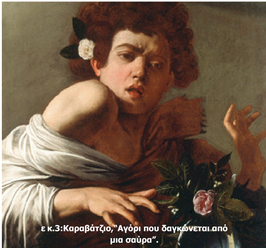
ε κ.3:Καραβάτζιο, "Αγόρι που δαγκώνεται από μια σαύρα".

Ο εκπαιδευτικός καλείται να επιλέξει από αυτό το υλικό κάτι που ως θέμα βρίσκεται κοντά στα εν-