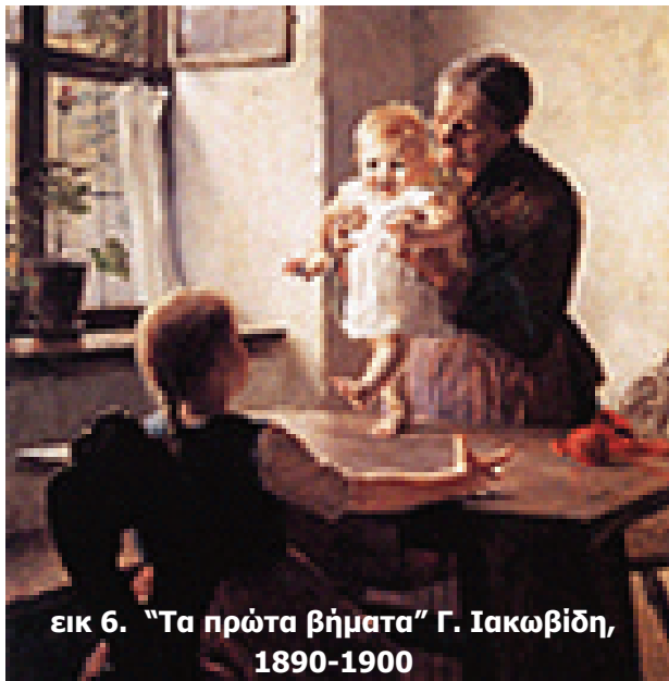
εικ 6. "Τα πρώτα βήματα" Γ. Ιακωβίδη, 1890-1900

του έργου, στο τέλος επιλέγουμε αυτόν που θεωρούμε όλοι ότι αποδίδει καλύτερα το νόημα του έργου