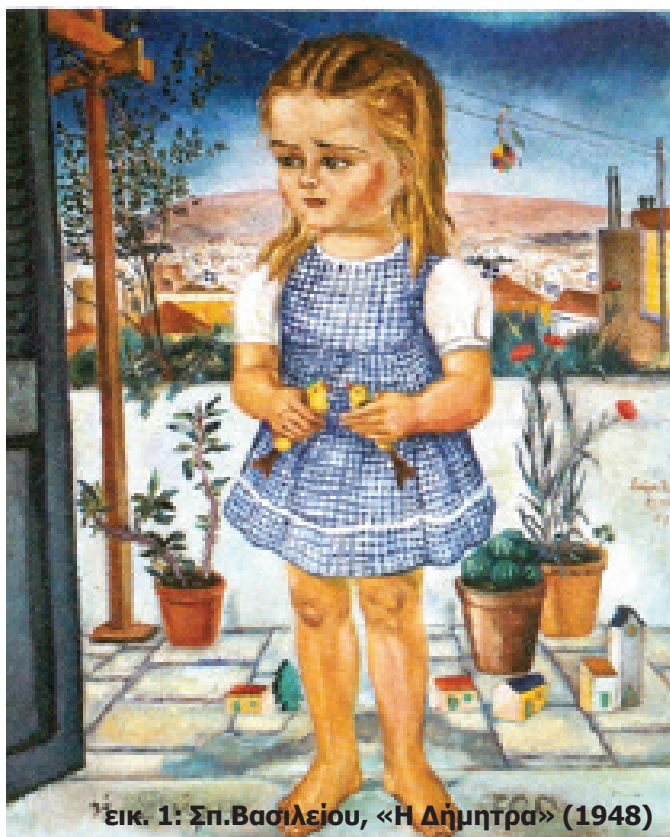
Εικ. 1: Σπ.Βασιλείου, «Η Δημητρά» (1948)

φοράς των παιδιών, είτε αυτά κατάγονται από τη χώρα μας είτε από οποιαδήποτε άλλη χώρα. Άλλωστε αυτή η τρυφερή ηλικία, δεν γνωρίζει χώρες και σύνορα. Προσκαλεί πάντα αυτόν που πραγματικά αισθάνεται κοντά της, που ξέρει να παρατηρεί τις αντιδράσεις και τις βαθύτερες σκέψεις, το θυμό, το γέλιο, το κλάμα, τις προσπάθειες για ανεξαρτησία, τα μικρά βάσανα εξ αιτίας των απαιτήσεων των ενη-