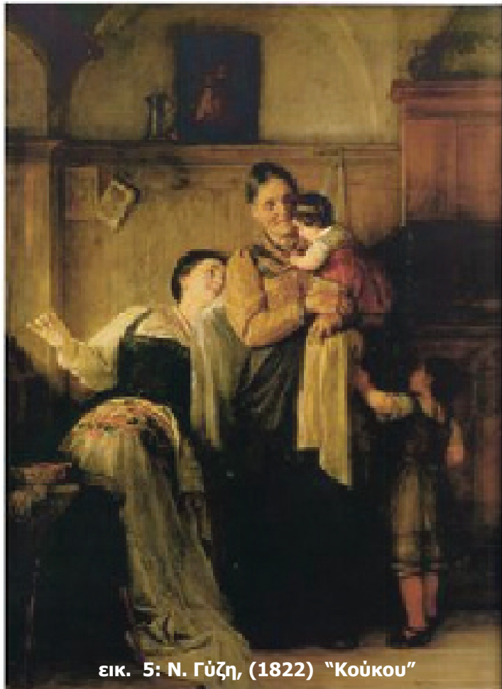
εικ. 5: Ν. Γύζη, (1822) "Κούκου"