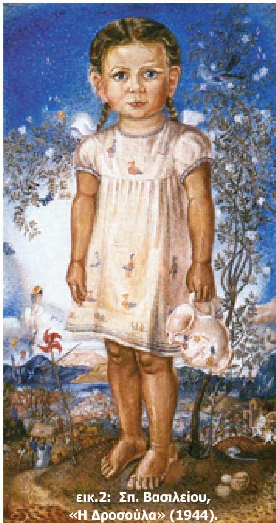
εικ.2: Σπ. Βασιλείου, «Η Δροσούλα» (1944).

λίκων, να τα αποδώσουν με τον ξεχωριστό τρόπο που τους αξίζει.